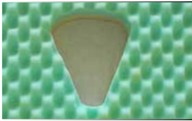
CUSCINO TIPO P

I cuscini Tipo P e Tipo V sono realizzati in due schiume poliuretaniche con diversa densità al fine di assicurare il giusto compromesso tra rigidità e comfort. Il foro, opportunamente realizzato, consente di scaricare il peso dalla zona perineale dell'utilizzatore.