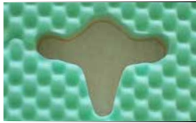
CUSCINO TIPO V